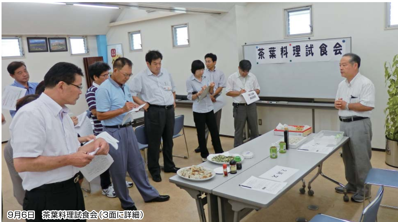
9月6日 茶葉料理試食会(3面に詳細)

No. 55 発行者 沼津市商工会 会長 大村保二 〈本所・原支所〉沼津市原1200番地の1 TEL (055) 966-1331 FAX (055) 967-4925 〈戸田支所〉沼津市戸田1028番地の5 TEL (0558) 94-2224 FAX (0558) 94-4029 編集 沼津市商工会広報委員会